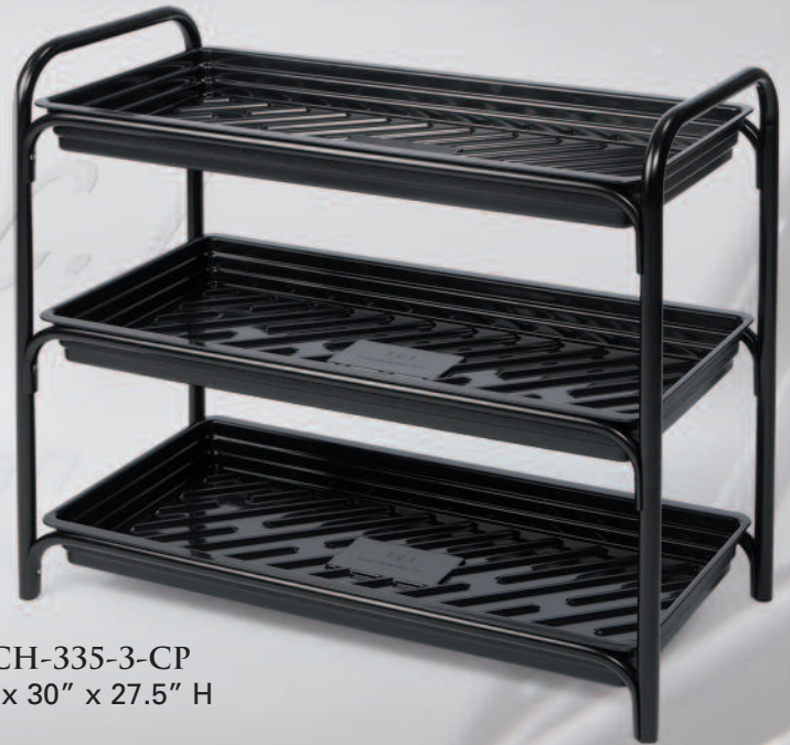
TCCH-335-3-CP 15" x 30" x 27.5" H