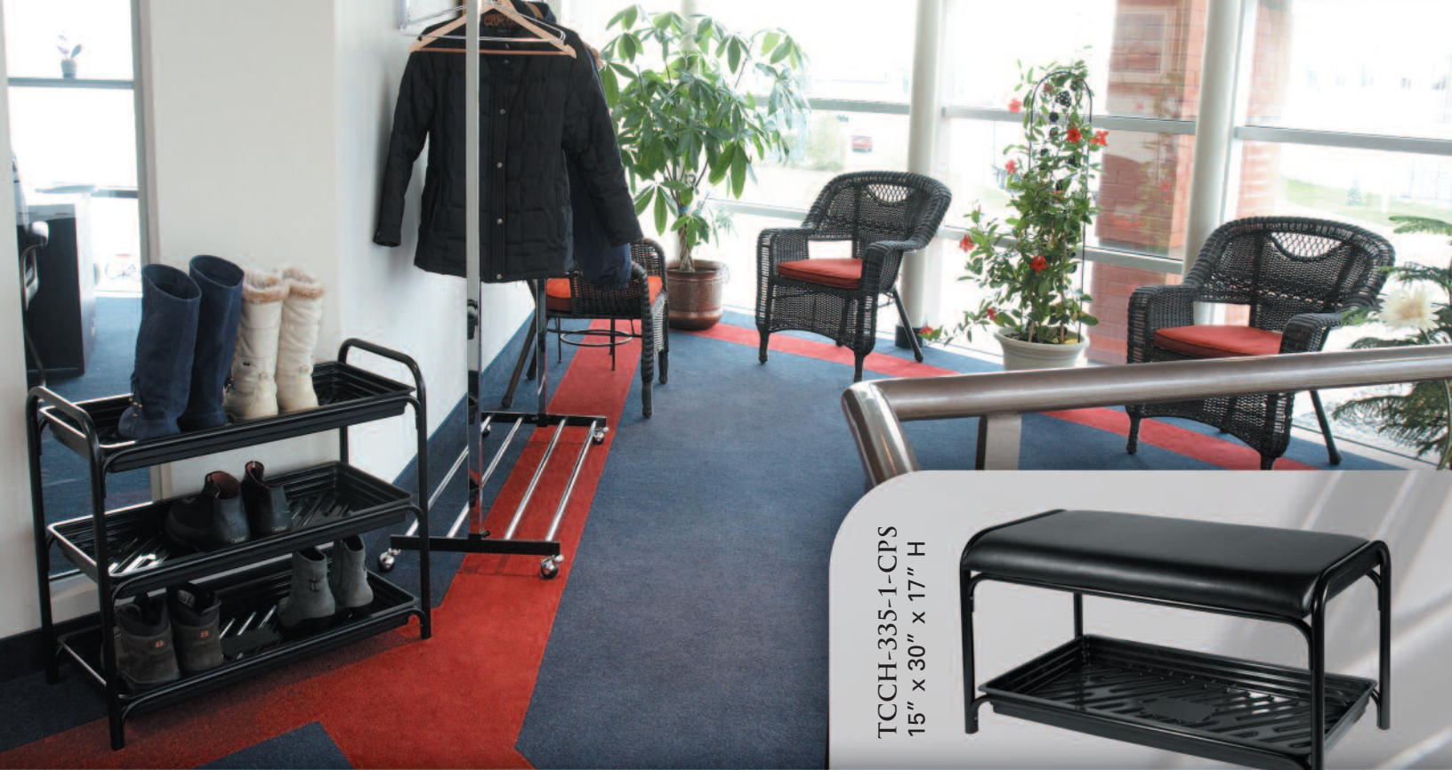
TCCH-335-1-CPS 15" x 30" x 17" H