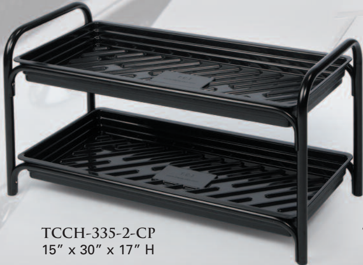
TCCH-335-2-CP 15" x 30" x 17" H